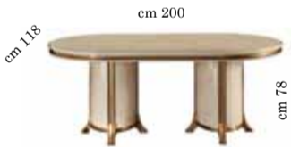
Oval fix top table Tavolo ovale fisso Овальный стол фиксированный