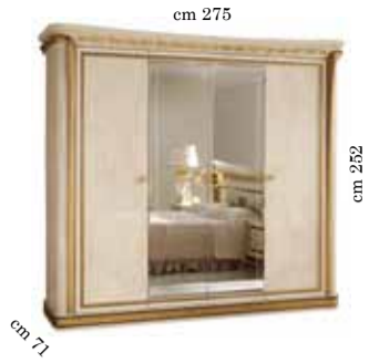
4/doors wardrobe h. 252 Armadio 4/ante h. 252 4-х дверный шкаф h. 252