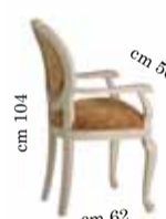
Armchair art. 200 Sedia c/braccioli art. 200 Стул с подлокотниками art. 200