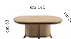
Coffee / Cocktail table Tavolo ovale salotto Журнальный столик