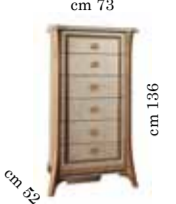
Tall chest Settimino Высокий комод