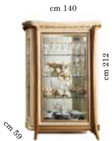
2/doors glass cabinet Vetrina 2/ante 2-х дверная витрина