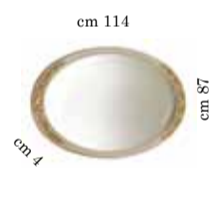
Mirror for 2/doors buffet Specchiera per contr. 2/ante Зеркало для 2 х дверного прилавка