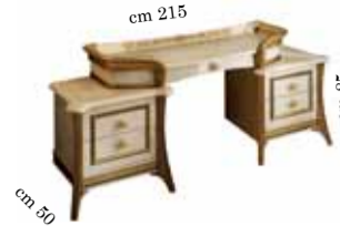
Dressing table Toilette Туалетный столик с ящиками