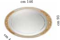
Large mirror for dressing table Specchiera grande per toilette Зеркало для туал. столика