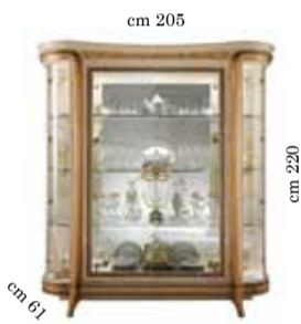
4/doors glass cabinet Vetrina 4/ante 4-х дверная витрина