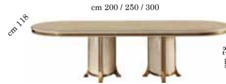
Oval table with 2/extensions Tavolo ovale con 2/allunghi Овальный стол раздвижной с 2 вставками