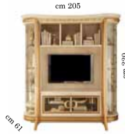
TV Wall unit comp. N. 20 Mobile TV comp. 20 Стенка под тв comp.20