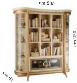
Bookcase Libreria Библиотека