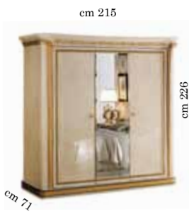
3/doors wardrobe h. 226 Armadio 3/ante h. 226 3-х дверный шкаф h. 226