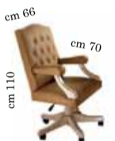
Office Armchair Poltrona Presidenziale Офисное кресло