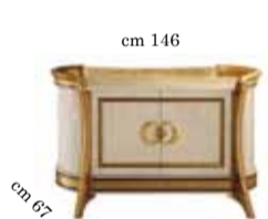
2/doors buffet Contromobile 2/ante 2-х дверный прилавок