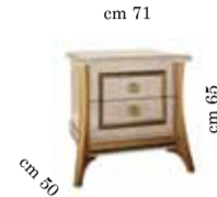
Night table Comodino Тумбочка